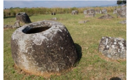
Laos - Vlakte Der Kruiken

Zo is de Unesco Werelderfgoedstad Luang Prabang met zijn uitbundige tempels een absolute must.